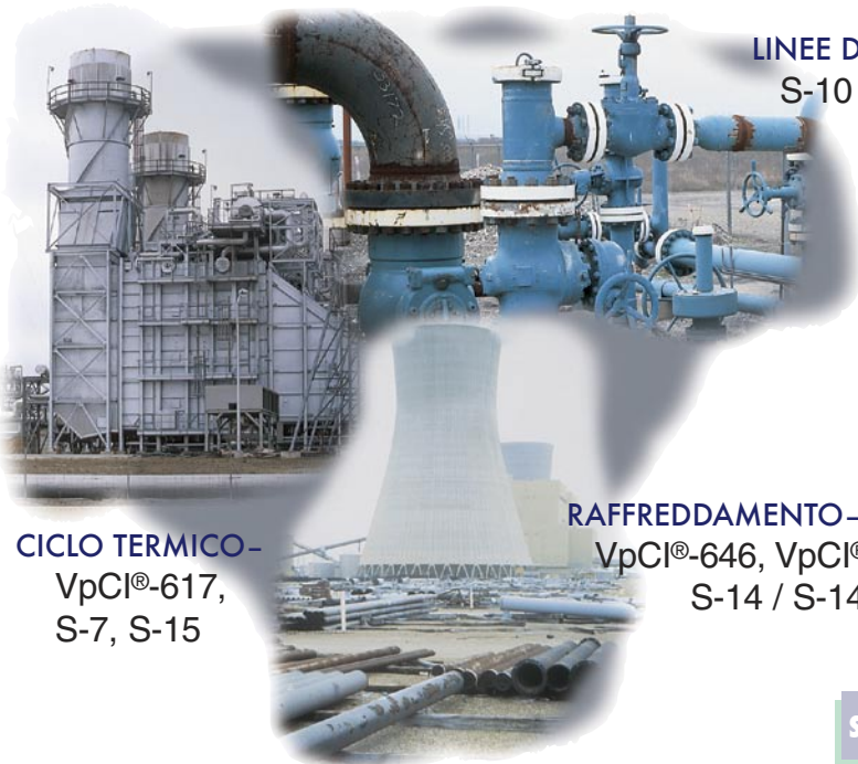
LINEE DEL CONDENSATO- S-10